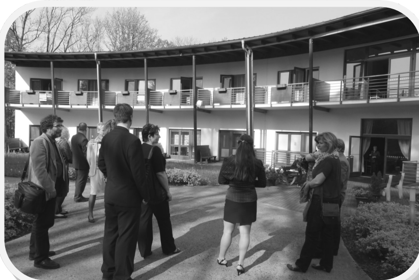
Zařízení Diakonie, Hospic Citadela, si 30.4. připomněl 10 let existence