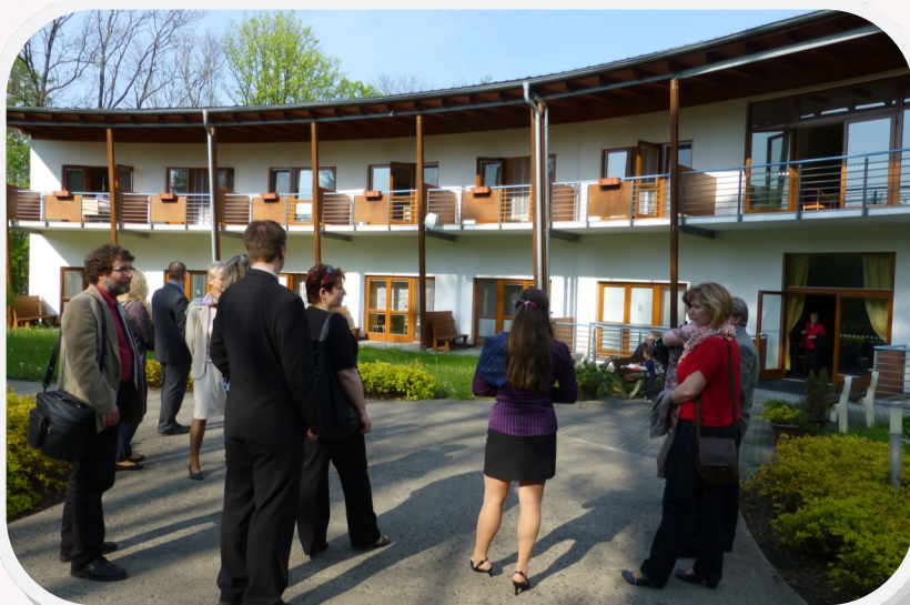
Zařízení Diakonie, Hospic Citadela, si 30.4. připomněl 10 let existence